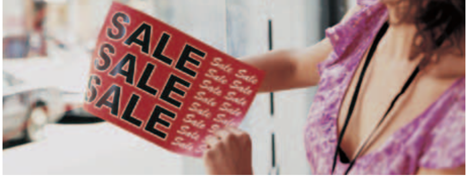
Xerox® NeverTear Cama Yapışan Reklamlar

Özel polyester EA Düşük Erime Noktalı Toner ısıtıcıları ile patentli bir kimyasal bağlama yöntemi kullanılarak polyestere basılan çıktı, polyester vb. alt tabakalar üzerinde mükemmel bir görüntü kalitesi sağlar. Premium NeverTear özellikli EA Tonerimiz su, yağ, gres ve yırtılmaya karşı dirençlidir.