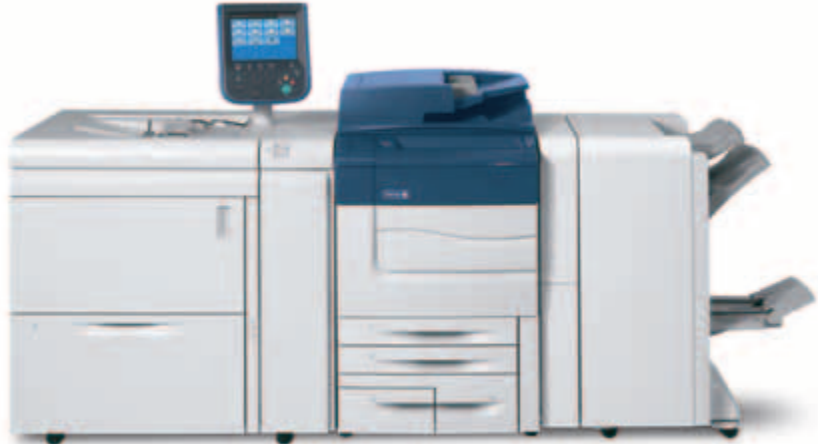
Xerox® C60/C70 ve yanında Bir Kasetli Büyük Boyutlu Yüksek Kapasiteli Besleyici ve BR Kitapçık Oluşturucu Son İşlemci.