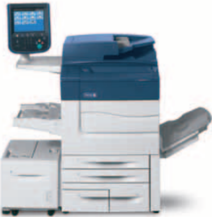
Xerox® C60/C70 ve yanında Yüksek Kapasiteli Besleyici.